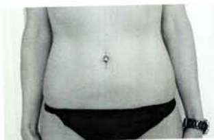
Avant-après Des hanches affinées grâce à la machine Tinaka.