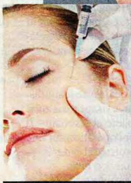
La toxine botulique fige...

Le coût. Environ 350 € pour les coins des yeux et 500 € pour un front entier.